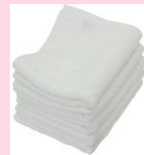
補正タオル (薄手フェイスタオル5枚)